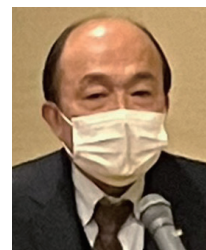
荻野会長エレクト